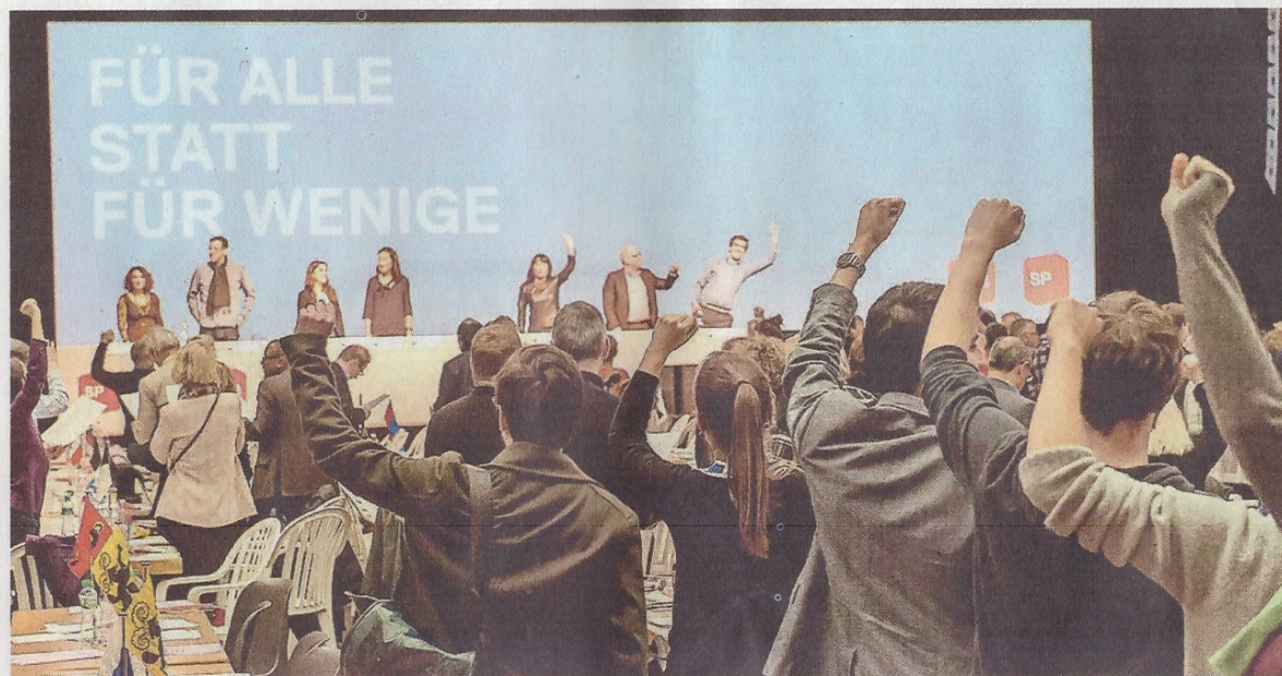
Kämpferische Posen am SP-Parteitag in Martigny. Daran wird man sich im Wahljahr gewöhnen müssen.

Der SVP frontal gegenüber stehen die Sozialdemokraten am linken Rand des politischen Spektrums. «Für eine Schweiz für alle, statt für wenige» lautet das übergeordnete Motto der SP-Wahlkampagne. Auch hier setzt man auf Bewährtes. Bereits 2011 ope-